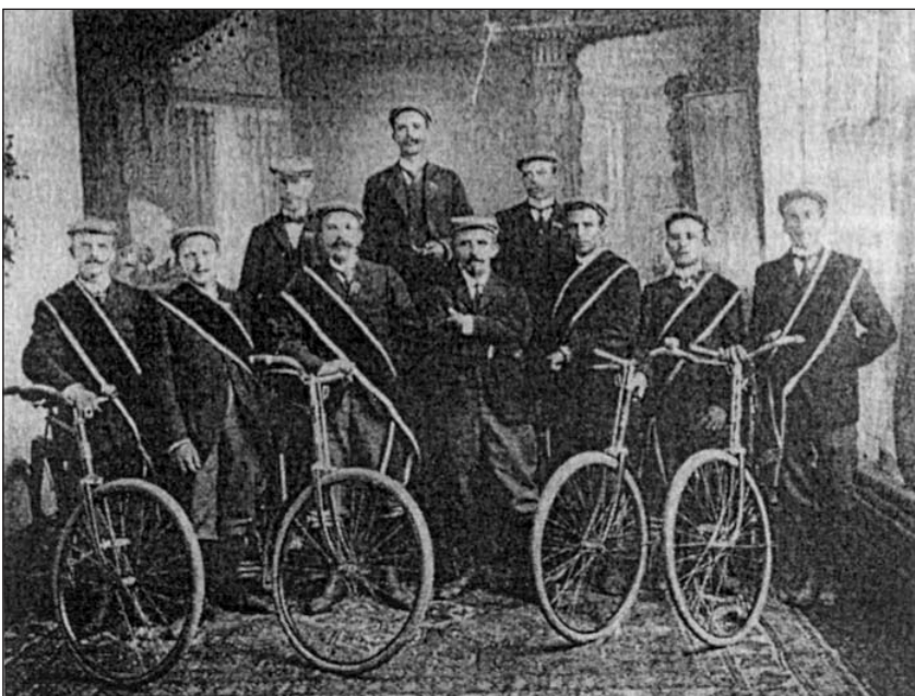
Mitglieder des »Jabachtaler Radfahrvereins Breidt« im Vereinsanzug

Vermutlich war die Errungenschaft »Fahrrad« längst zum Allgemeingut geworden, und es bedurfte keines Radfahrer-Vereins mehr, als 1913 andere sportliche Aktivitäten in Breidt Fuß fassten. Am 29. Juni 1913 kam es laut Satzung zur Gründung des Turn-Vereins Breidt .